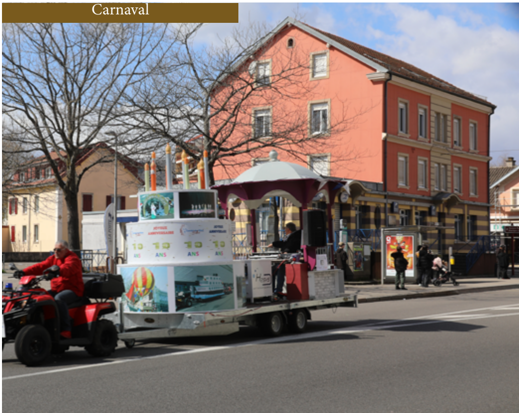
Passage des chars Avenue Jean Jaurès