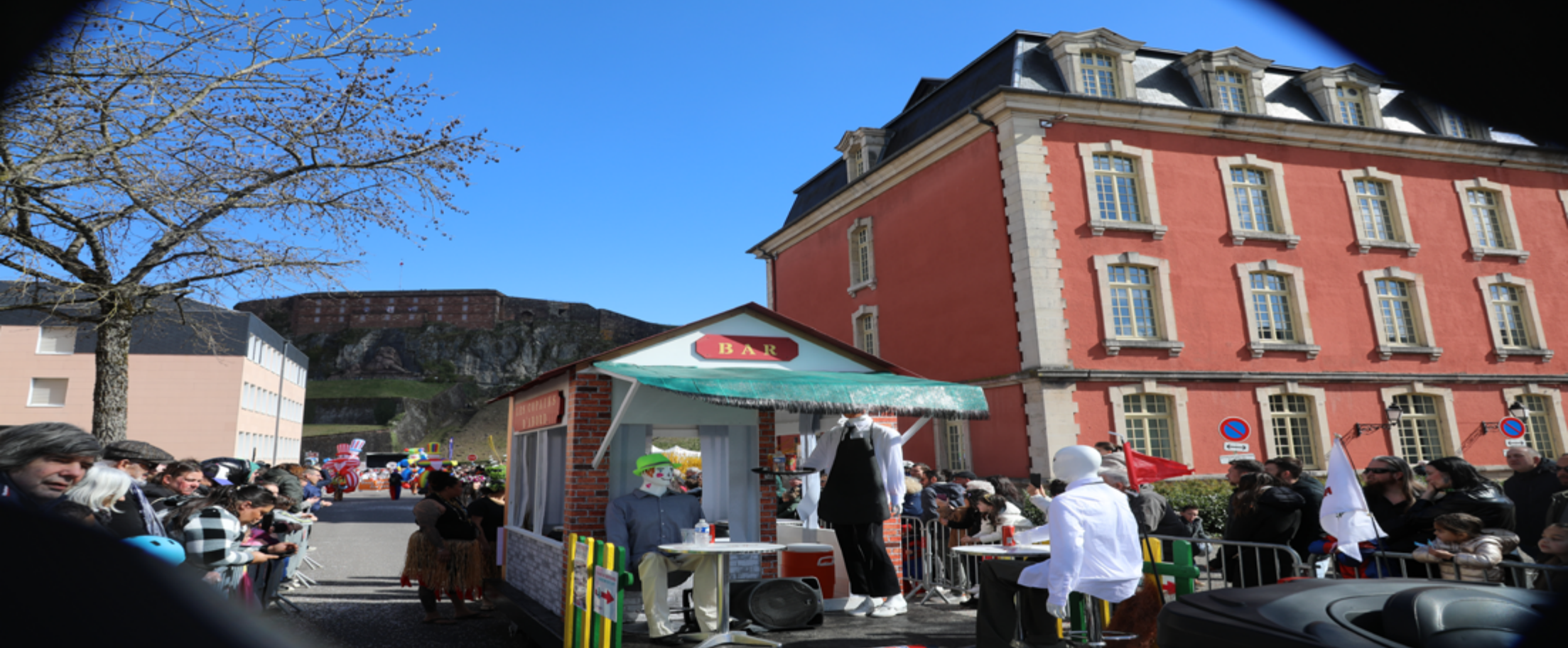
Départ du carnaval direction centre ville