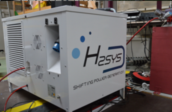
Un grand merci à la société H2SYS pour le prêt d'un groupe électrogène à hydrogène

6000 personnes présent pour le carnaval de BELFORT