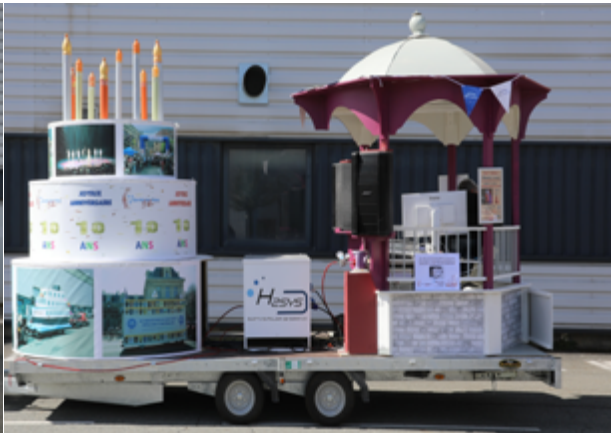
Préparation avant le départ