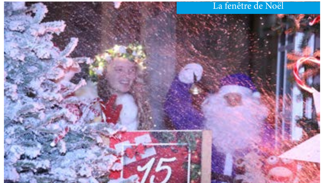
Neige ouvre la fenêtre du jour